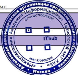
Схема № 1